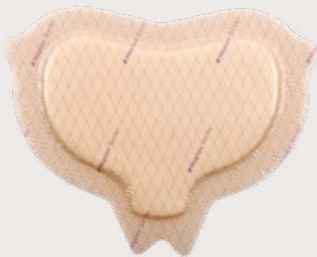
Mepilex® Border Sacrum

Gracias a la innovadora tecnología Deep Defense, Mepilex® Border Sacrum, protege los tejidos profundos y evita que la herida evolucione a un grado superior, además de acompañar el movimiento del cuerpo 12,13,14,15 :